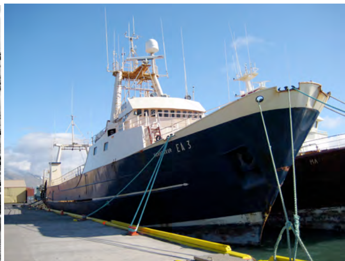
Allt sem flaut - breyttist í nútímaleg fiskiskip

Og það var einmitt orkan, sem gerði landið byggilegt í upphafi og stóð undir myndun velmegunnar. En velmegun getur af sér auðnuleysingja, sem ekki þurfa að vinna. Í vöntun á afþreyingu mótmæla þessir ónytjungar ástæðunni fyrir eigin velferð, en þeim er vorkunn því þeir vita ekki betur. Um þverbak keyrir svo þegar 'nei'-arar komast í lykilstöður, því þar úrskurða þeir þvert ofan í vilja landslýðs; oftast þó gegn sér sjálfum.