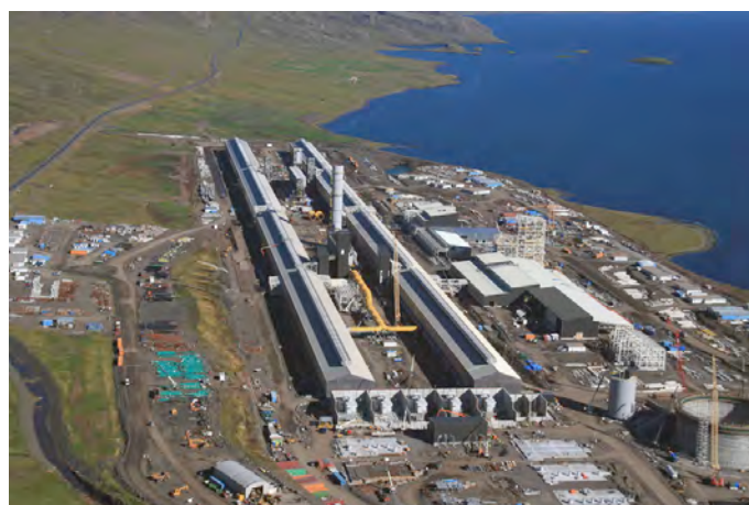
Gúanó og lifrabræðslur - breyttust í álver

Mannkynssagan sýnir að þjóðfélög verða misgömul. Sum Kínversku valdatímabilin og Indíánaríki Mið- og Suðurameríku urðu margra alda gömul og eitt Rómverska ríkið varð meira að segja sjö hundruð ára. Hinsvegar varð kommúnismi Lenins rúmlega sjötugur og þriðja ríki Adolfs bara tólf ára. Fróðir fræðimenn kenna að menning þróist hægfara í byrjun,